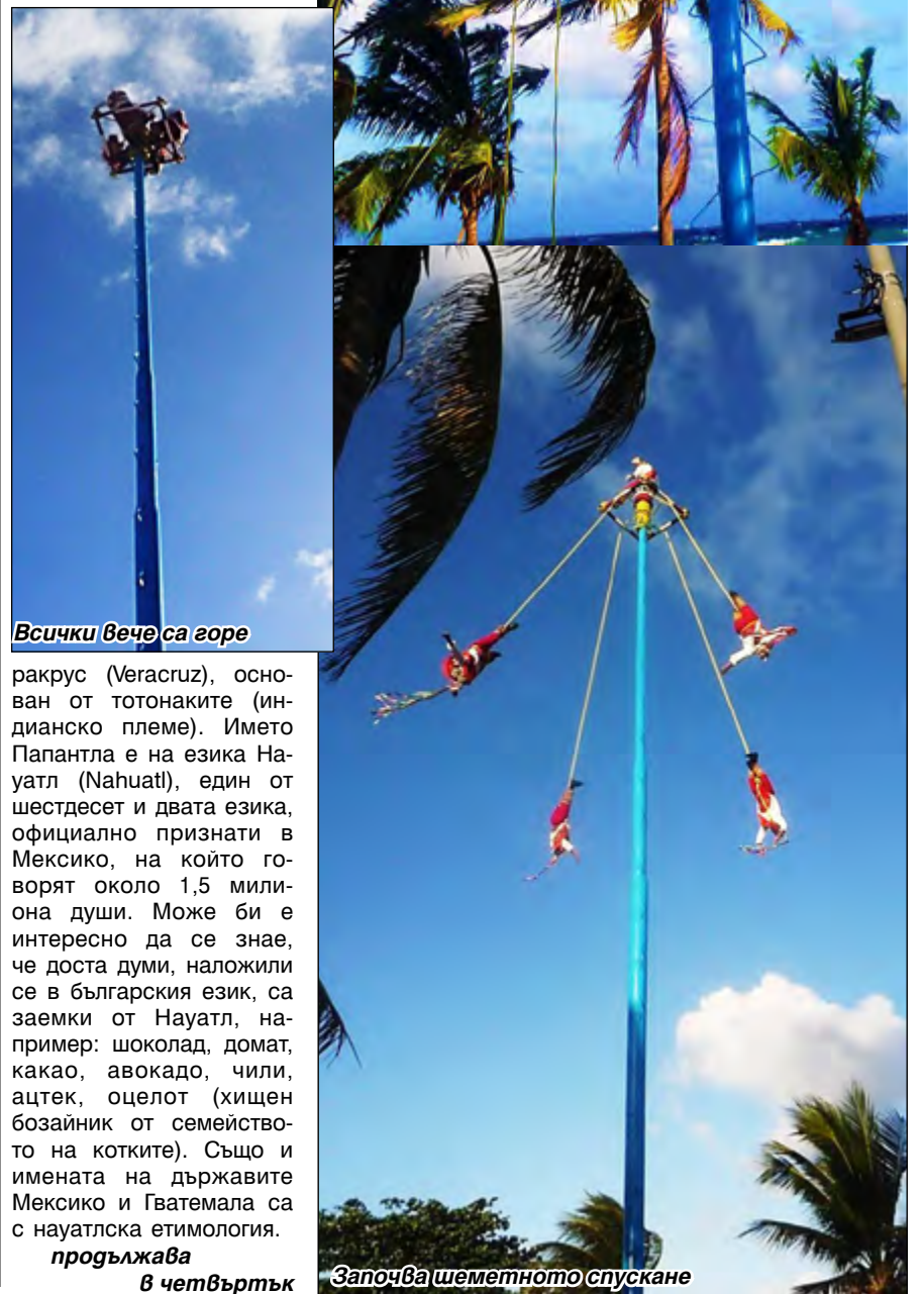
Всички вече са горе

ракрус (Veracruz), основан от тотонаките (индианско племе). Името Папантла е на езика Науатл (Nahuatl), един от шестдесет и двата езика, официално признати в Мексико, на който говорят около 1,5 милиона души. Може би е интересно да се знае, че доста думи, наложени се в българския език, са заемки от Науатл, например: шоколад, домати, какао, авокадо, чили, ацтек, оцелот (хищен бозайник от семейството на котките). Също и имената на държавите Мексико и Гватемала са с науатлска етимология.