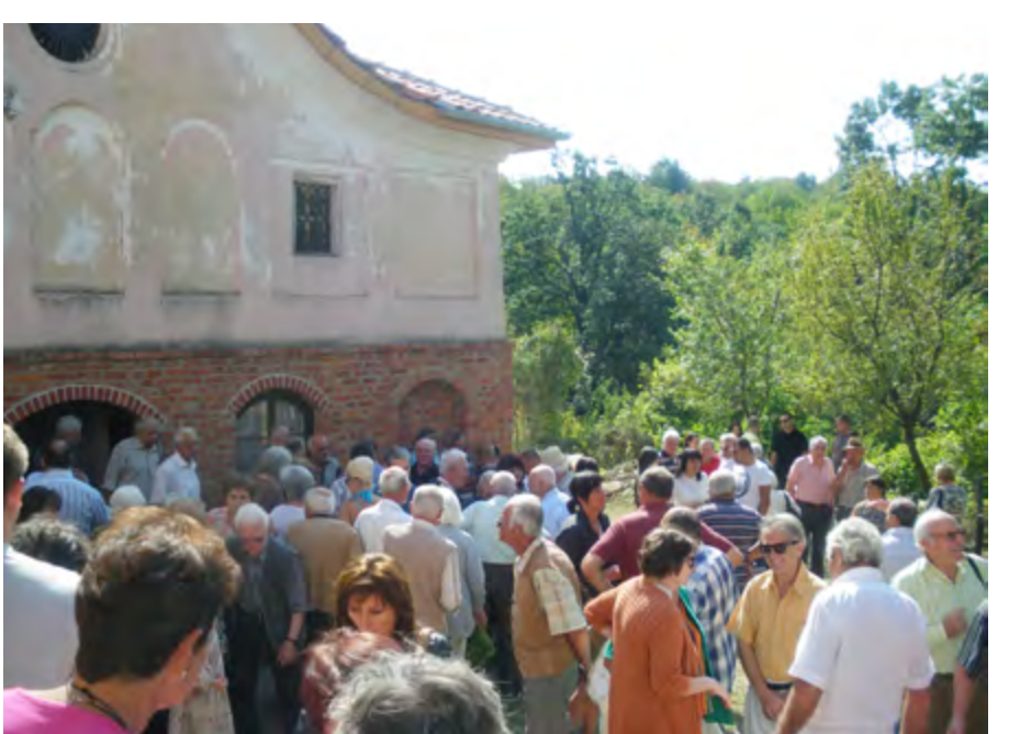
Храмов празник на 8 септември 2012 г. Църковният двор е изпълнен с хора.

Днес почитаме годишнината на този храм и трябва с любов да си