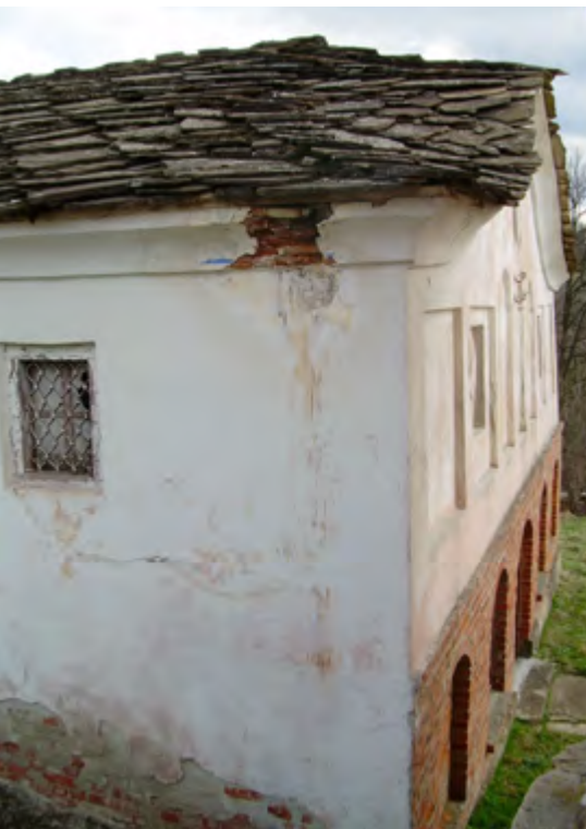
Месец март 2008 г. църквата преди ремонта

13 септември 2012 година. На 8 септември 2023 година църквата „Рождество на Пресвета Богородица“ навърши 150 години. Наранина местните хора влизаха в двора,