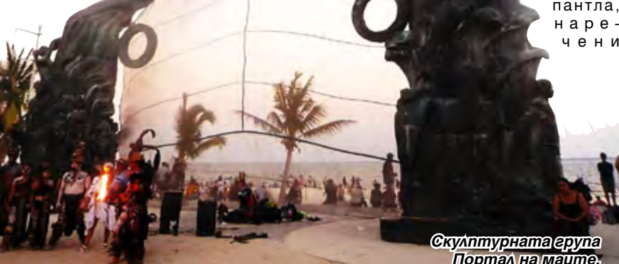
Скулптурната група Портал на майте, посветена на техния живот и култура

Но това, което привлича най-силно внимание, е величествената скулптурна композиция Портал на майте (Portal Maya).