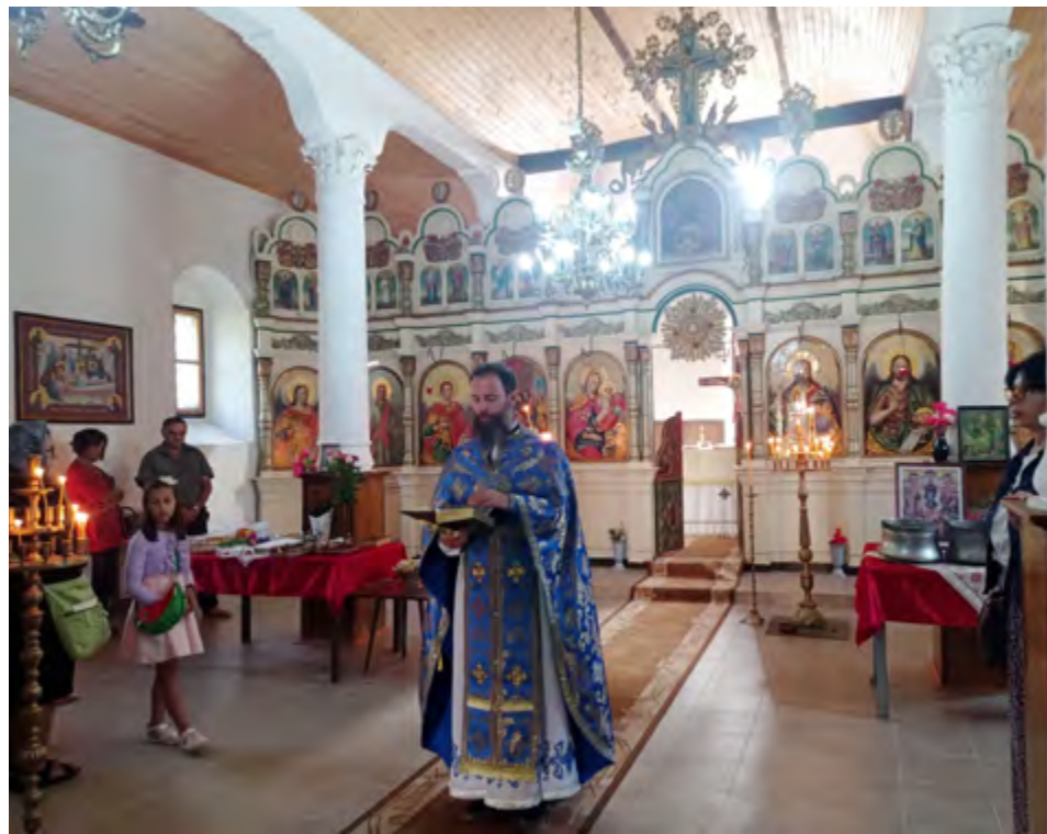
Тържествена литургия в „Рождество на Пресвета Богородица“. 8 септември 2023 г.