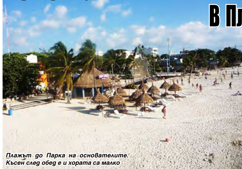
Плажът до Парка на основателите. Късен след обед е и хората са малко