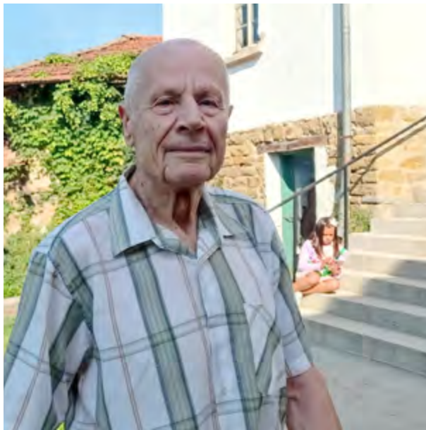
проф. Андрей Кавалов. 8 септ. 2023 г.