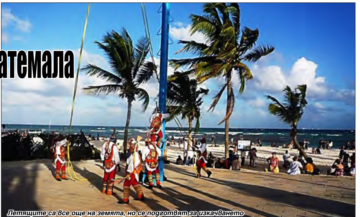
Летящите са все още на земята, но се подготвят за изкачването

вал слънчевите и лунните затъмнения за стотици и хиляди години напред. Календарът внезапно и мистериозно свършвал на 21 декември 2012 г. Това е породило много тълкувания, пророчества и спекулации. Според календара, на тази дата Слънцето щяло да достигне до центъра на Млечния път и заедно със Земята ще застанат в положение, което се случва веднаж на 25 800 години. Майте не са предсказали какво ще последва, но смятали, че ще бъде нещо ужасно. Тази дата вече е в миналото и знаем, че нищо такова не се е случило, но много хора са вярвали и са се подготвяли за галактическа катастрофа.