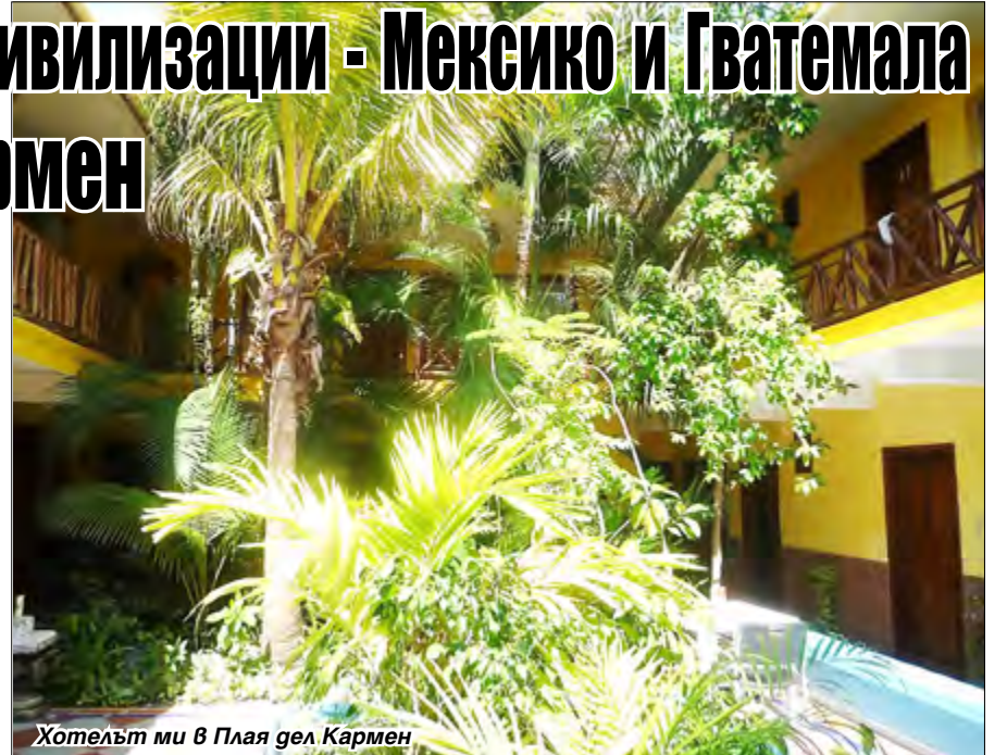
Хотелът ми в Пляя дел Кармен